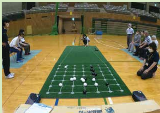
囲碁ボール交流会

今年も囲碁ボール交流会を開催します! 定期的に囲碁ボールを行っているという方は腕試しに、まだ囲碁ボールをやったことがない方も、囲碁ボールの第1歩として参加してみませんか?