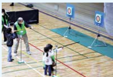
スポーツウエルネス吹き矢

卓球、野球、ソフトテニス、陸上、柔道、バレーボール、剣道、水泳、空手、バスケットボール、ソフトボール、新体操、テニス、バドミントン、サッカー、なぎなた、ゲートボール、ゴルフ、太極拳、ラグビー、車いすバスケットボール、スポーツウエルネス吹矢など様々な体験教室に自由に参加することができます。皆さまのご来場をお待ちしています。