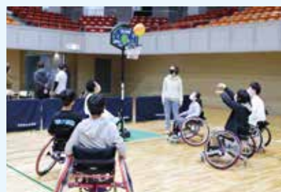
車いすバスケットボール