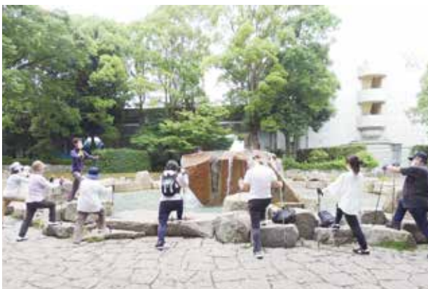
ノルディックウォーキング②

総合公園の園庭で開催されるスポーツ教室として、ノルディックウォーキング(中級)教室があります。今年は、バラが見ごろだった6月23日(木)に周回園路を中心に実施しました。バラ園や日本庭園などにも立ち寄り、豊かなみどりの中でのノルディックウォーキングを楽しみました。