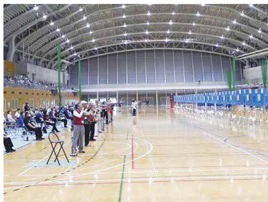
神奈川県大会 会場：ひらつかサン・ライフアリーナ

これらの繋がりから、ねんりんピック神奈川大会において平塚市を会場に開催することが決定しました。