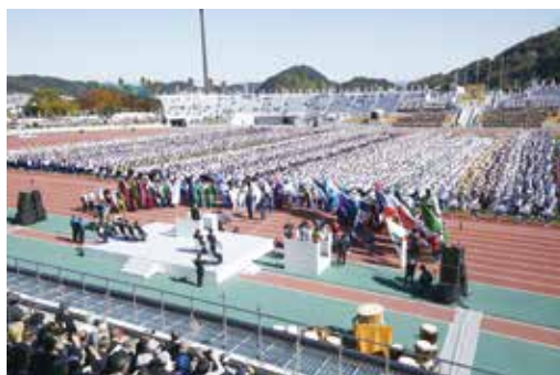
第32回和歌山大会（2019年）総合開会式