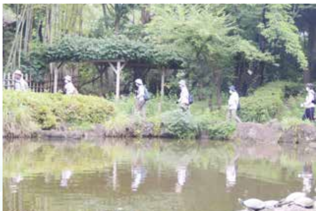
ノルディックウォーキング①

今回は第10回と市制90周年を記念して、スポーツ体験教室のほか、スポーツに関連する著名人をお招きして開催する予定です。お子様をはじめ多くの方のご参加をお待ちしています。