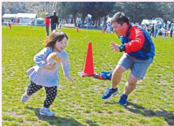
市民スポーツフェスティバルの様子②

令和5年3月26日(日)に、平塚市総合公園にて「第10回ひらつか市民スポーツフェスティバル」を開催します。午前9時30分から午後3時まで、平塚市スポーツ5団体にご協力いただき、各種スポーツの体験教室などを行います。