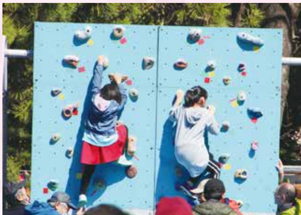
市民スポーツフェスティバルの様子①