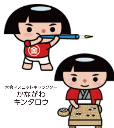
大会マスコットキャラクター かながわ キンタロウ