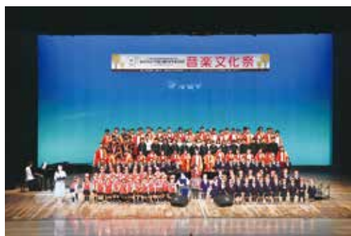
第32回和歌山大会 音楽文化祭

ふれあいと活力ある長寿社会の形成に寄与するため、厚生省（現：厚生労働省）創立50周年を記念して昭和63（1988）年に開始されて以来、毎年開催されています。