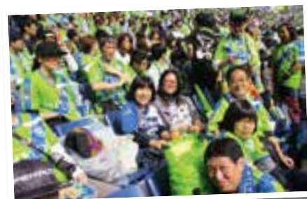
シーズンを通してチームに力を与えたサポーターの皆さん