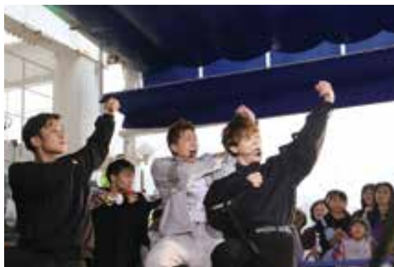
会場でのミニライブ

現在は、当財団と教育委員会スポーツ課とで開催している「手話ダンス教室」、平成26年度から市内小・中学校での公演、毎年3月開催のひらつか市民スポーツフェスティバル会場でのミニライブなど、手話やダンスを通して、多くの市民の皆さんと共に活動されています。