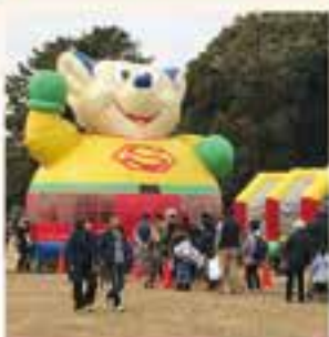
楽しいふわふわ道具