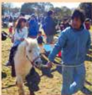
ポニーに乗馬しよう