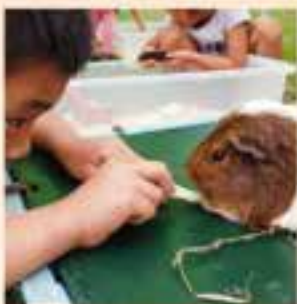
かわいい動物が集合