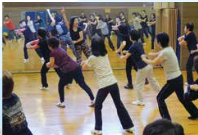
ゆっくりエアロビクス教室

お問い合わせ 公益財団法人平塚市まちづくり財団 スポーツ事業課 ☎0463-35-0102 HP アドレス http://www.hiratsukazaidana.jp