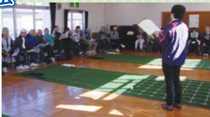
講習は用具の取り扱いから

この講習会は、毎年平塚市まちづくり財団が主催し開催していますが、今回は市民の皆さんから認定証を取得したいという要望があったため、八幡公民館が中心となり講習会を開催することになりました。