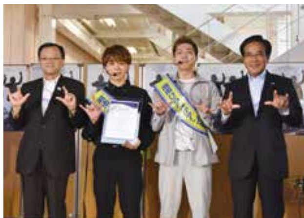
委嘱状を手に手話パフォーマンス

デビューシングルに収録された『僕が君の耳になる』『この手で奏でるありがとう』はどちらも音楽活動を通じて出会った人の実話をもとにしています。ドラマ仕立てのミュージックビデオが口コミで話題となりYouTubeの再生回数は270万回を超えました。