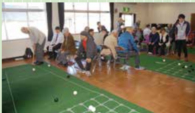
ライン得点、ポイント得点を学ぶ

この講習会は、毎年平塚市まちづくり財団が主催し開催していますが、今回は市民の皆さんから認定証を取得したいという要望があったため、八幡公民館が中心となり講習会を開催することになりました。