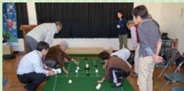
1局終了後に得点を数える

参加された皆さんは、今後は、地区等で囲碁ボールのリーダーとして活躍していただくことになります。