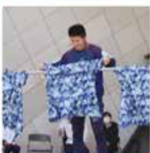
ギネス平塚記録に挑戦しよう 屋敷ひらつか七タラハランドリーチャレンジ