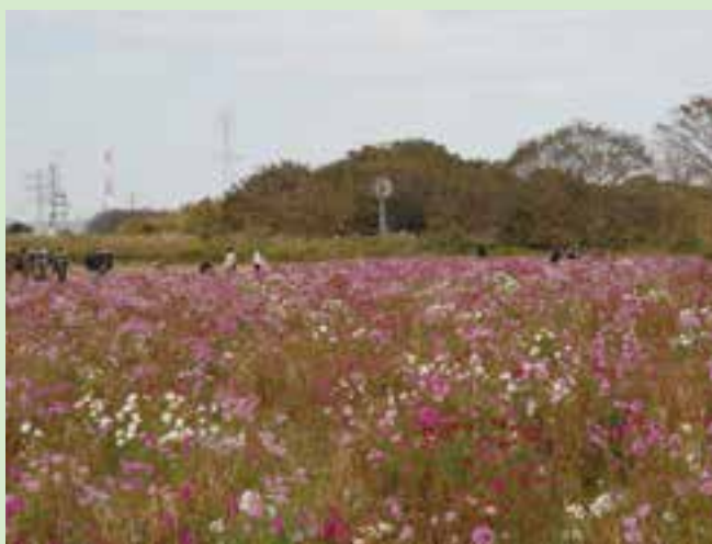
会場となる馬入・光と風の花づつみ

日 時 平成31年2月2日(土)午前9時30分～12時 雨天中止の場合は、2月9日(土) 集合 馬入ふれあい公園内サイクルセンター 会 場 馬入水辺の楽校、馬入・光と風の花づつみ周辺 内 容 ポイント・オリエンテーリング(講義、実践、まとめ) 対 象 小学生以上 募集人員 20名 ただし、小学生低学年は父兄同伴 参 加 料 1人500円 申し込み 1月18日(金)から電話で当財団スポーツ事業課(☎35-0102)へ